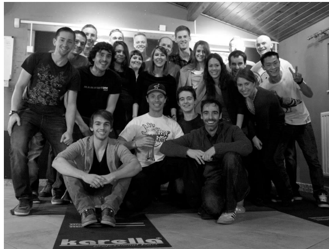
Das erste National Climber Meeting im Jahr 2013 mit rund 30 Teilnehmern.

Lux-Cup 2014 statt, bei dem sich zahlreiche Sportbegeisterte in Caspers Klettergeschäft trafen, um gemeinsam die Finalrunde der besten Kletterer in Luxemburg genießen zu dürfen. Damit wurde zum ersten Mal in der luxemburgischen Klettergeschichte ein Boulderevent in einem Kletterladen durchgeführt.