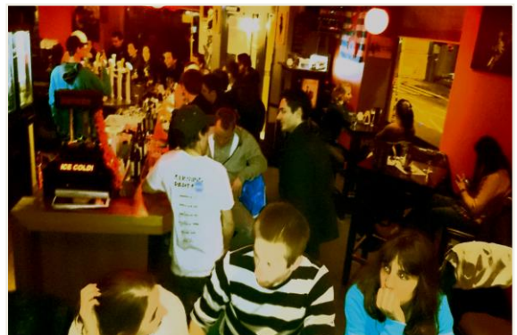
Die zweite Edition des National Climber Meeting im Jahr 2014 im Anschluss an den Lux-Cup im All In Cafe.

Auch 2015 lädt IClimb.lu zum National Climber Meeting (NCM) ein. Die diesjährige Edition findet am 30. Mai 2015 während dem ING NIGHT MARATHON im Schulhof des Boulder Klub Letzebuerg statt. Im Mittelpunkt steht das Zusammenkommen der Sportler aus unterschiedlichen Vereinen und Kletterhallen. Egal ob Boulderer, Sportkletterer oder Alpinist, am NCM ist jeder willkommen.